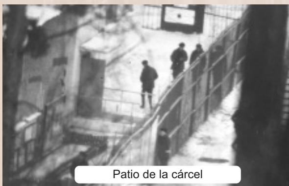
Patio de la cárcel

Contento con la idea, recogí mis pocos artículos y mi ropa. Seguí al